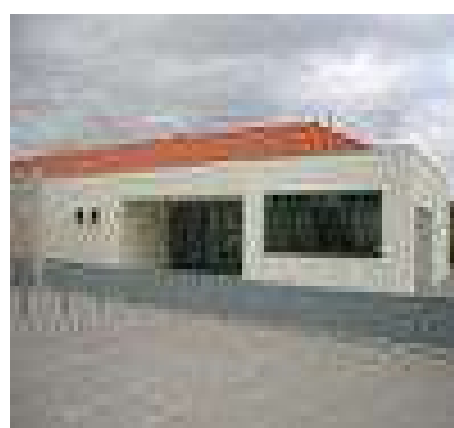
2-Centro de dia