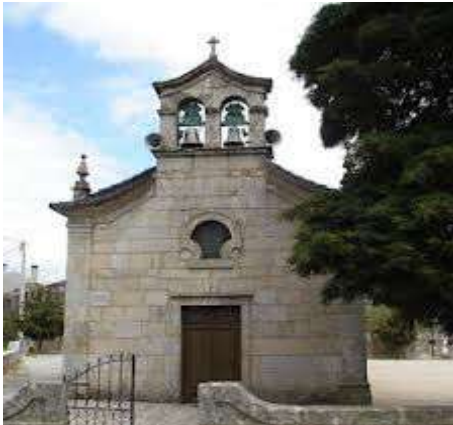
11-Igreja matriz Forles