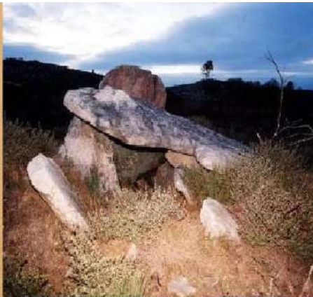
13-Orca de Forles

69. Entraram os seguintes objectos: a) dois vasos de barro quasi inteiros, e quatro grandes fragmentos outros; b) um grande machado de pedra; c) uma ponta de seta de sílex, e uma ponta de seta de crystal de rocha; d) um fragmento de faca de sílex; e) dois nucleos de crystal de rocha; f) tres pequenas contas de schisto; Todos estes objectos provem da orca (dolmen) de Forles, no concelho de São João, explorada por mim em Setembro de 1896. Epocha lithica.