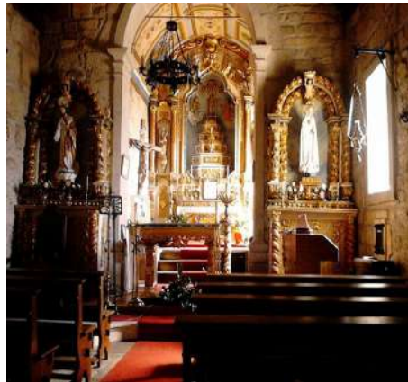
11-Interior igreja matriz Forles