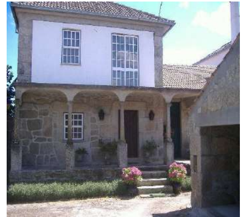
12-Solar Família Soeiro