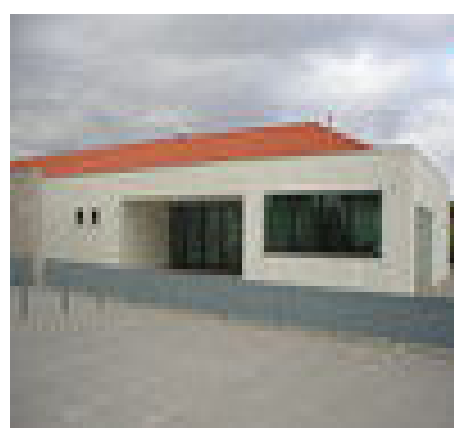
2-Centro de dia