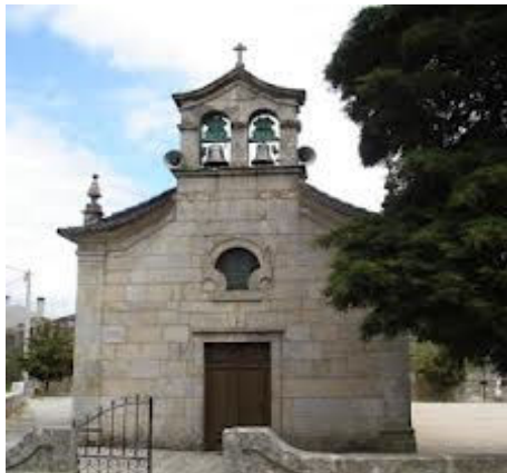
11-Igreja matriz Forles