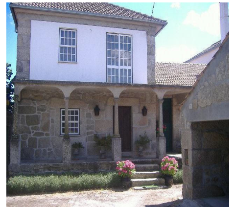
12-Solar Família Soeiro