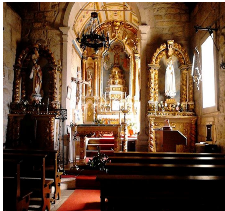
11-Interior igreja matriz Forles